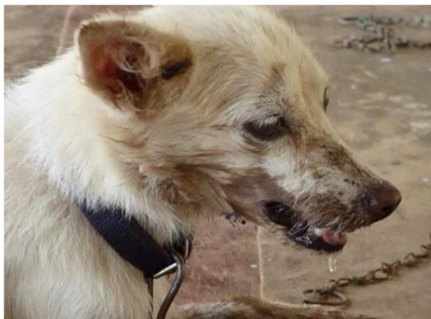
Сурет 1 - Иттің құтыруының клиникалық көрінісі

Құтыру ауруының негізгі көздері - жабайы жыртқыштар, иттермысықтар, кейбір жерлерде-жарғанаттар.